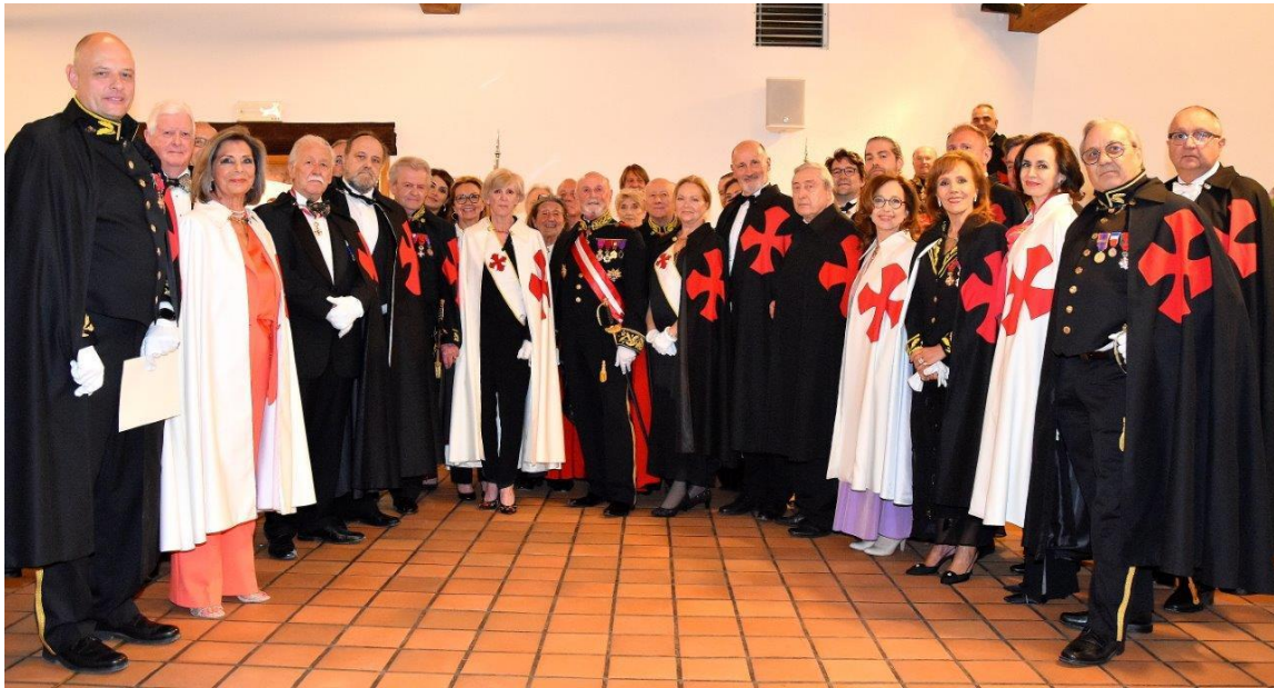
Une centaine d'invités autour des membres du Chapitre du Benelux.